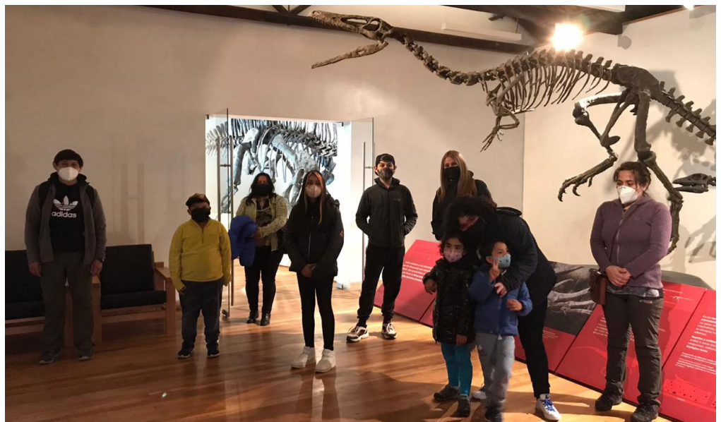
Visita a la exposición itinerante, Dinosaurios, más allá de la extinción , con agrupaciones “Te acompañamos” y “Asperger Patagonia”.