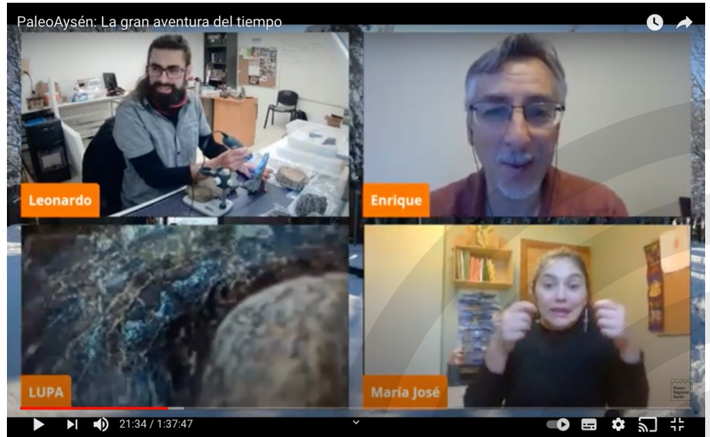
Incorporación de lenguaje de señas en actividades virtuales del museo.

Posteriormente, debido al contexto sanitario y a la creciente actividad virtual del museo, se consideró incorporar en las actividades virtuales a una intérprete en lengua de señas, además de realizar un llamado especial a la comunidad sorda de la región a ser parte de estas actividades.