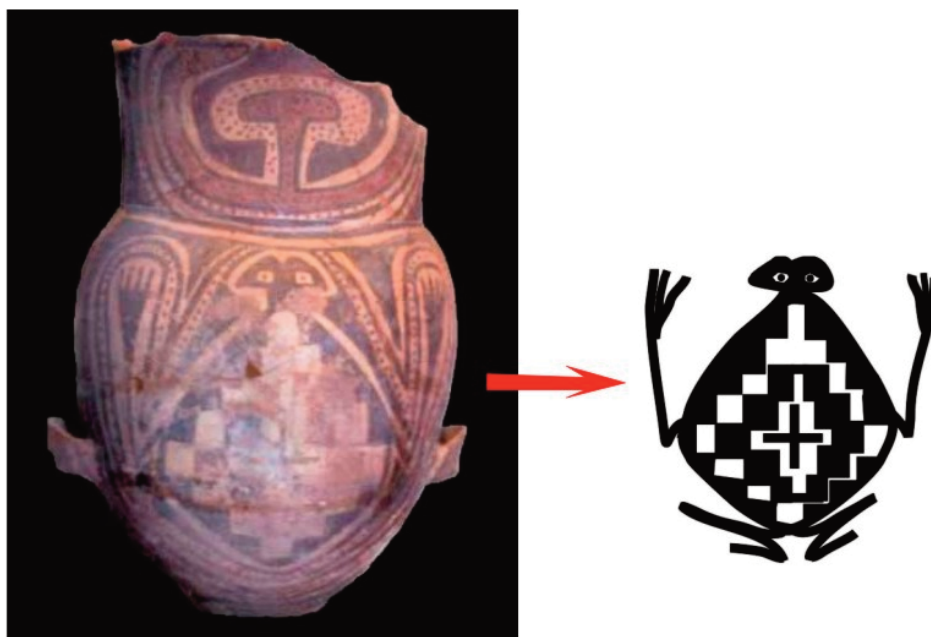
Figura 1. Alfarería de estilo Santamariano (Noroeste Argentino, Período Tardío: 900-1480 AD). Izquierda: urna con representación de batracio, pintura negro y rojo sobre blanco (modificada de Nastri y Stern Gelman, 2011: 32, figura 5); derecha: detalle esquemático del motivo del batracio.

Algunos autores del siglo XIX han interpretado a ciertas imágenes figurativas plasmadas en el arte rupestre o en esculturas en piedra como representaciones de la divinidad (Quiroga, 1992 [1931]). Se ha propuesto también que las imágenes de batracios, presentes en el repertorio de motivos pintados en urnas funerarias del denominado estilo Santamariano de la zona de los Valles Calchaquíes, habrían sido una manifestación visual de la Pachamama 1 (Mariscotti de Görlitz, 1978; Nastri, 2009). Estos sapos ocupan todo el cuerpo de vasijas (figura 1) empleadas como contenedores de restos mortales de niños para su entierro. En el NOA existe una milenaria tradición prehispánica de utilizar reci-