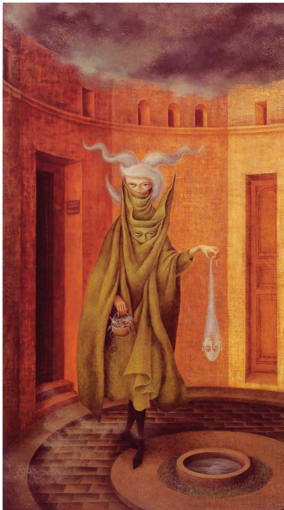
Instituto Nacional de Bellas Artes de México. SIGROPAM: 29541. Mujer saliendo del psicoanalista (podría ser Juliana) (1960), de Remedios Varo.

A partir del movimiento feminista, que ha dejado importantes huellas no solo en el campo político y social, sino también en el cultural, en los últimos años, el número de las