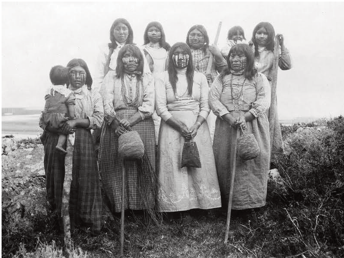
Mujeres del pueblo yagán en Puerto Remolino. Museo Antropológico Martin Gusinde. Martin Gusinde, 1919. Gentileza Anthopos Institut.

Para el Estado chileno, el extremo austral del continente y sus habitantes no habían sido objeto de mayor interés, incluso había sido llamado como «la tierra maldita».