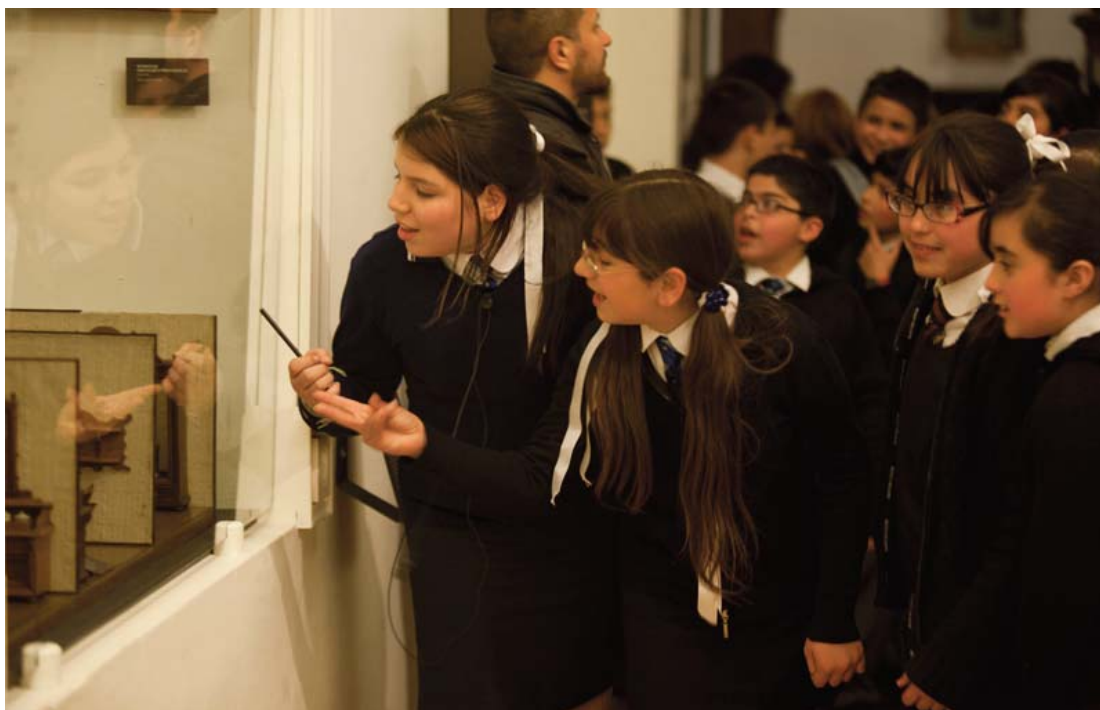
Estudiantes en el Museo Histórico Nacional, 2011.

Examinaremos una iniciativa que, si bien se enmarca en una política pública nacional y transnacional, se activa y recrea a pequeña escala de un modo singular.