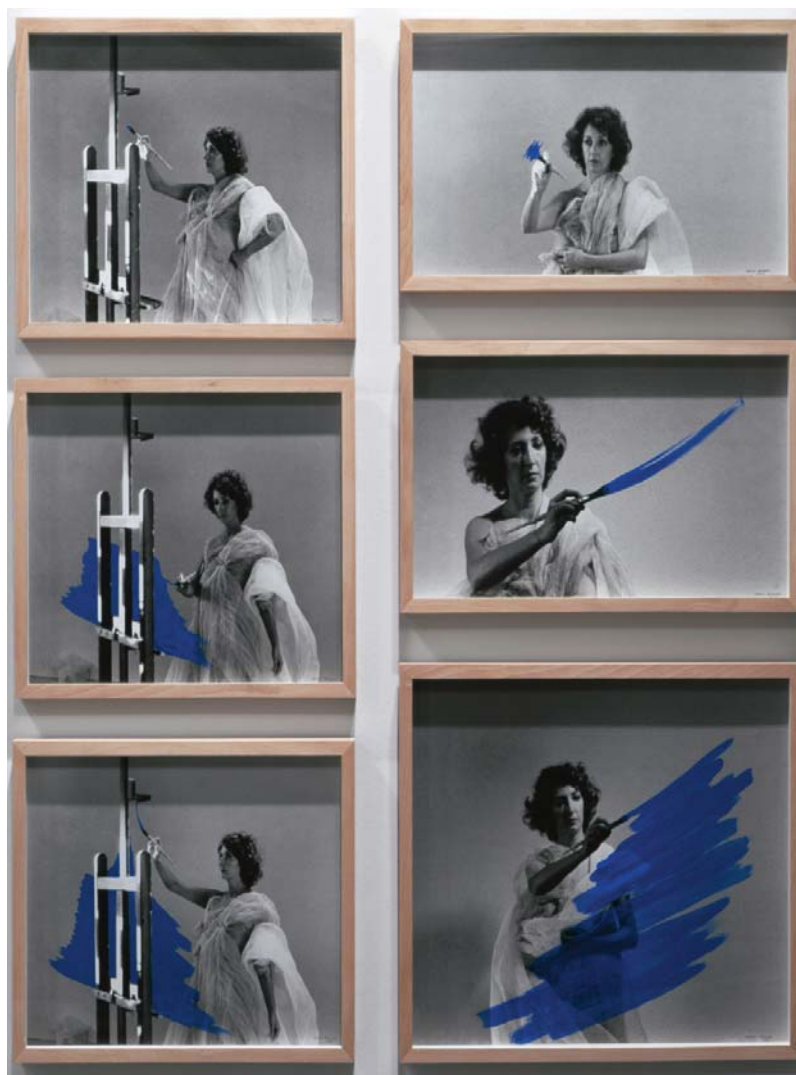
Museu Nacional de Arte Contemporânea - Museu do Chiado. N.º Inv. 2597. Pintura habitada (1974), de Helena Almeida. Imágen: ADF/DGPC; Mário Valente, 2001.

crítico de arte Monteiro Ramalho, decorada com obras dos mais modernos jovens artistas frequentadores, por iniciativa e encomenda do proprietário.