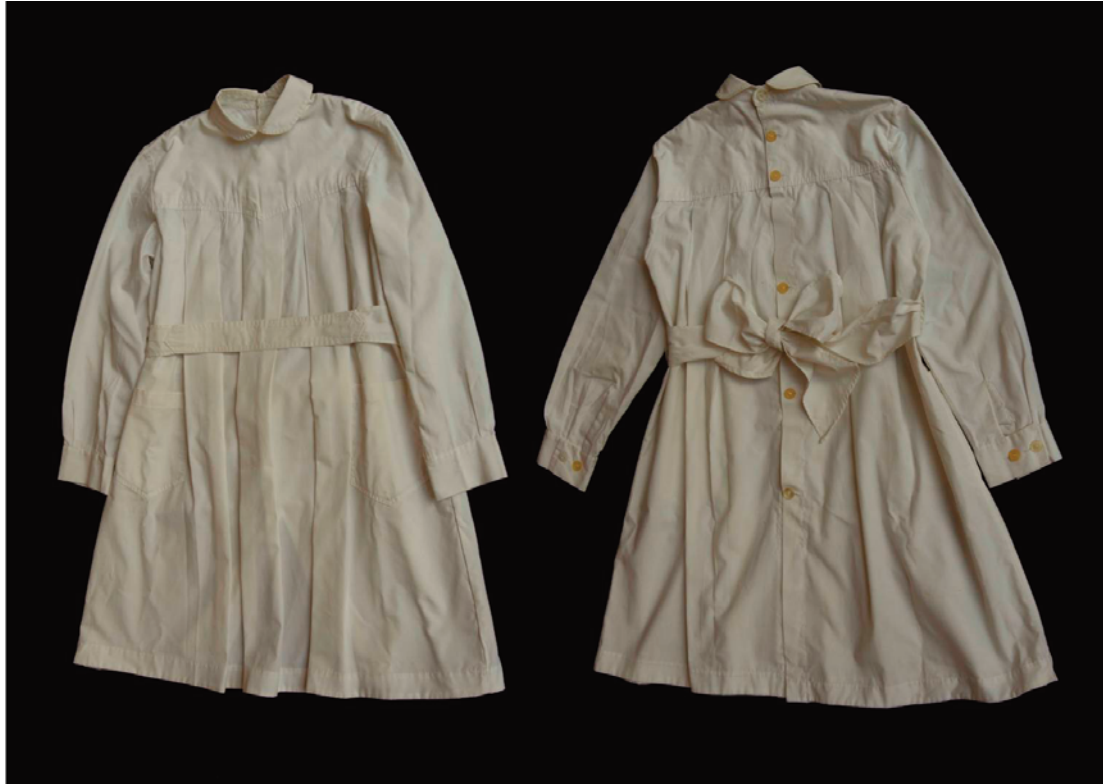
Túnica de niña de Escuela Pública (década del 70, siglo xx). Frente y dorso.

el sainete de Pepino el 88 . Este retrataba a los guapos del barrio del Cordón como: «gente de pelo en pecho/con quien hay que andar derecho pues no es manco pa'el facón/es de muy mala intención». Agregaba que, «Aquí en Montevideo/son los taitas majaderos del compadraje oriental/ porque se ha hecho general/entre los de rompe y raja la camiseta y la faja/la más chillona golilla/ pues hasta usan gran cuchilla que de dos cuartas no baja» (Podestá. J. s/f: 62-63).